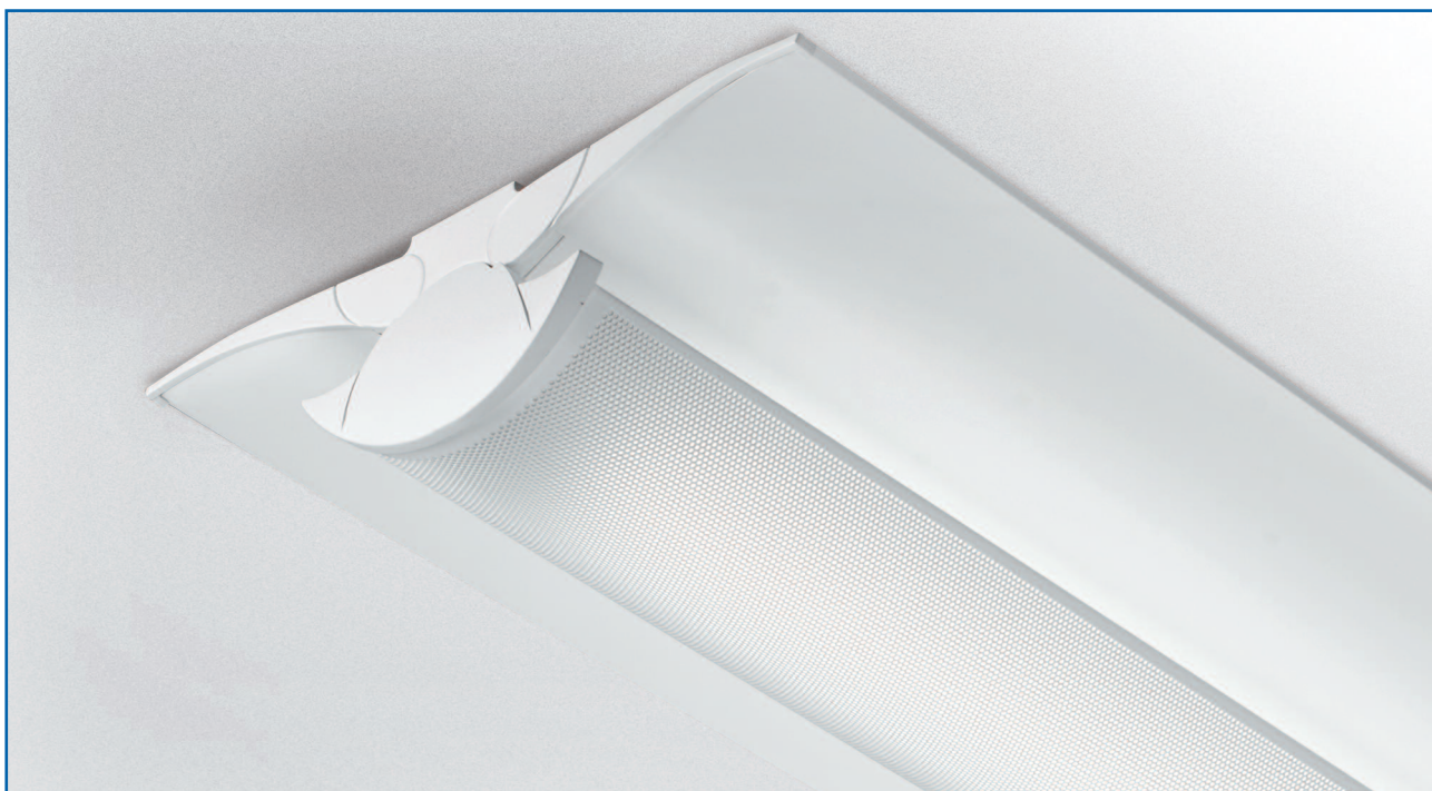
Waveform T5 с перфорированным рассеивателем